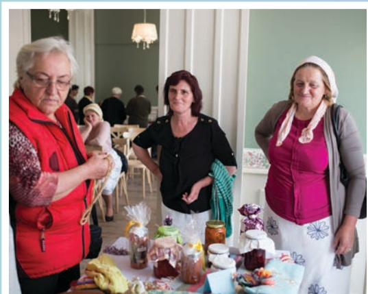
Дебарски бањи, април 2017.